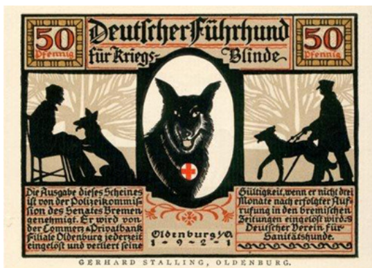
Ilustrácia núdzových peňazí okolo rokov 1921

V tomto období, okolo roku 1920, sa vodiace psy dokonca stali predlohou pre tlač takzvaných núdzových peňazí v Nemecku. 3